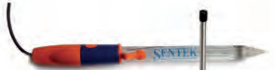
JENWAY 3510-3520 pH Metreler / SENTEK 118-75 Çamur pH-Elektrodu JENWAY 3510-3520 pH Meters / SENTEK 118-75 Slurry pH-Electrode