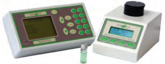
HPEA/LPA2 Sıvı-Faz Klorofil Florimetresi Liquid-Phase Chlorophyll Fluorimeter