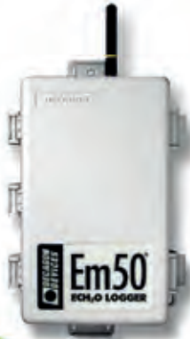
DECAGON Em50/Em50R/Em50G Veri Toplama Cihazları Dataloggers