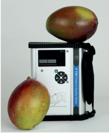
F-750 Meyve Kalitesi Ölçüm Cihazı Produce Quality Meter