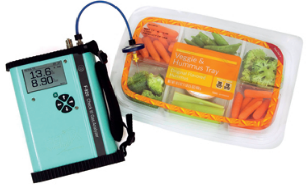
F-920 Check It! Gaz Analizörü (CO 2 , O 2 ) Check It! Gas Analyzer (CO 2 , O 2 )