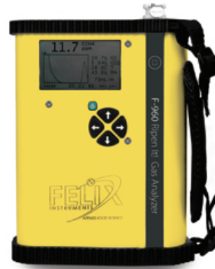
F-960 Ripen It! Gaz Analizörü (Etilen , CO 2 , O 2 ) Ripen It! Gas Analyzer (Ethylene , CO 2 , O 2 )