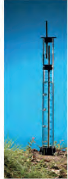
DECAGON Minidisk İnfiltrometre İnfiltrometre