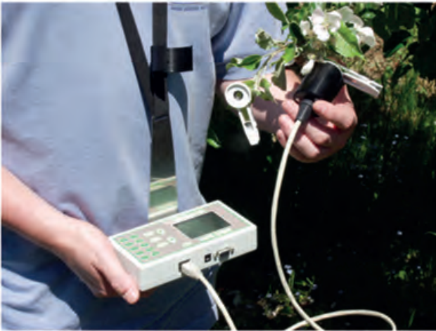
Handy PEA Portatif Klorofil Florimetresi Portable Chlorophyll Fluorimeter