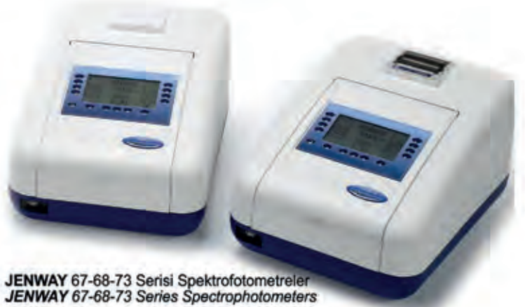
JENWAY 67-68-73 Serisi Spektrofotometreler JENWAY 67-68-73 Series Spectrophotometers

Toprak - Gübre - Bitki - Su Analizleriniz ve Irrigasyon - Fertigasyon Gözlemleriniz için