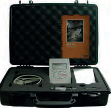
DECAGON KD-2Pro Isıl Özellikler Analizörü Thermal Properties Analyzer