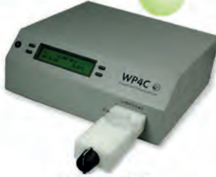
DECAGON WP4C Su Potansiyeli ve Solma Noktası Tayin Cihazı Water Potential and Wilting Point Analyzer