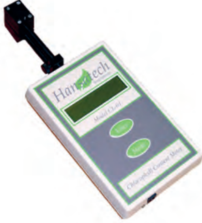
CL-01 Klorofil Miktarı Ölçüm Cihazı Chlorophyll Content Meter