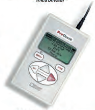
DECAGON Pro-Check Portatif Sensör Okuma Cihazı Portable Sensor Readout