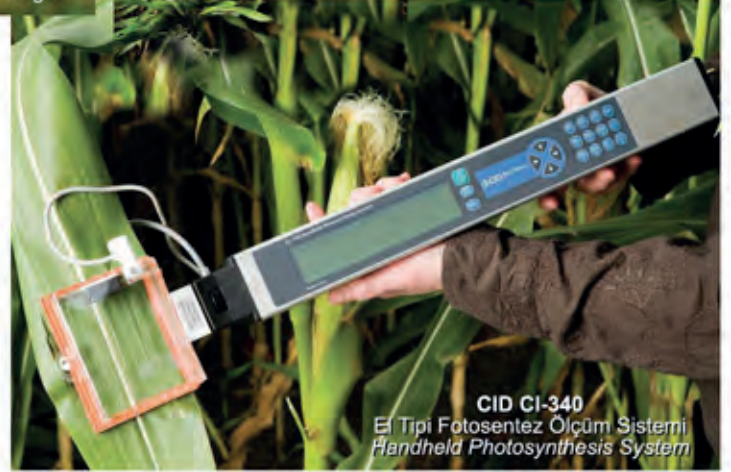
CID CI-340 El Tipi Fotosentez Ölçüm Sistemi Handheld Photosynthesis System