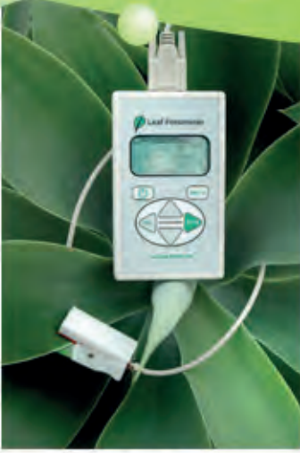
DECAGON SC-1 Yaprak Porometresi Leaf Porometer