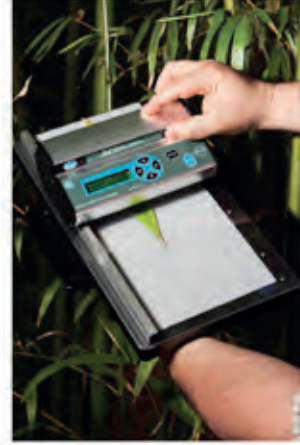
CID CI-202 Portatif-Lazerli Yaprak Alanı Ölçme Cihazı Portable-Laser Leaf Area Meter