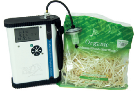
F-950 Üç Gaz Analizörü (Etilen , CO 2 , O 2 ) Three Gas Analyzer (Ethylene , CO 2 , O 2 )