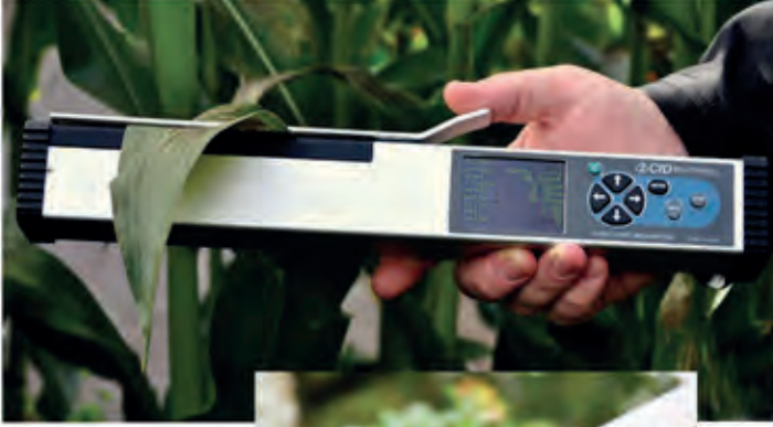
CID CI-203 El Tipi-Lazerli Yaprak Alanı Ölçme Cihazı Handheld-Laser Leaf Area Meter