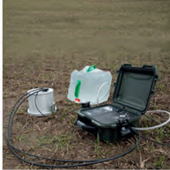
DECAGON DUAL HEAD Otomatik İnfiltrometre-Çift Basıncılı Automatic Infiltrometer-Dual Head