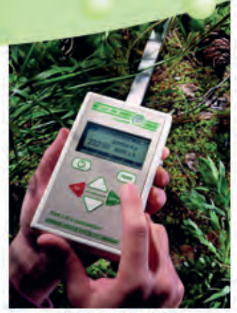
DECAGON LP-80 PAR/LAI Septometre PAR/LAI Ceptometre