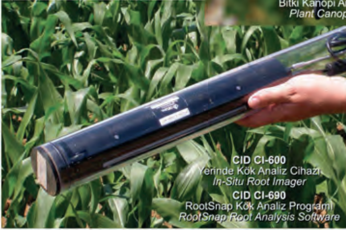
CID CI-600 Yerde Kök Analiz Cihazı In-Situ Root Imager CID CI-690 RootSnap Kök Analiz Programı RootSnap Root Analysis Software