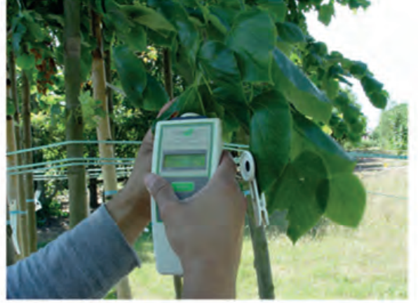
Pocket PEA Ultra-Portatif Klorofil Florimetresi Ultra-Portable Chlorophyll Fluorimeter