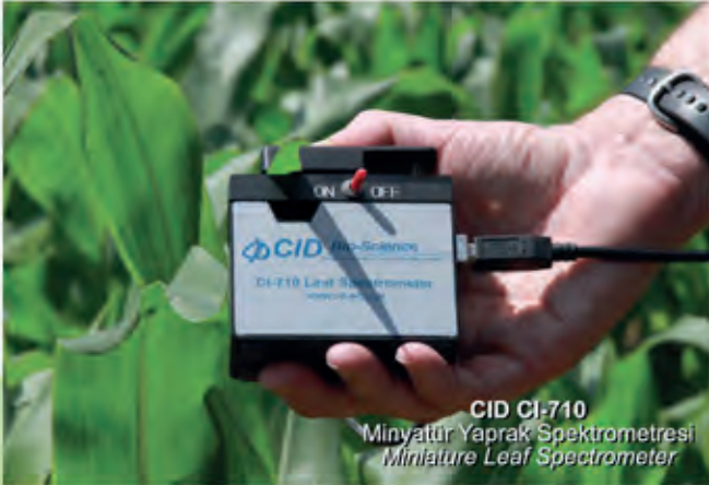
CID CI-710 Minyatür Yaprak Spektrometresi Miniature Leaf Spectrometer