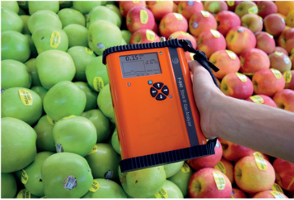
F-940 Store It! Gaz Analizörü (Etilen , CO 2 , O 2 ) Portable Chlorophyll Store It! Gas Analyzer (Ethylene , CO 2 , O 2 )