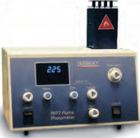
JENWAY PFP.7 Alev Fotometresi Flame Photometer

BİLMAR BİLİMSEL ARAŞTIRMA VE MÜHENDİSLİK A.Ş.