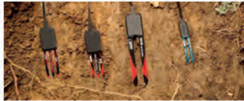
DECAGON ECH2O Toprak Nemi Ölçme Sensörleri Soil Moisture Sensors