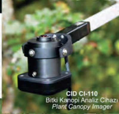
CID CI-110 Bitki Kanopi Analiz Cihazı Plant Canopy Imager